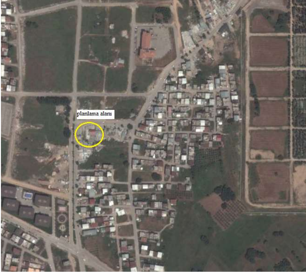
Planlama alanı

Bursa İli, Osmangazi İlçesi, H21b 25c pafta, 10518 ada, 10 parsel 1/5000 ölçekli Osmangazi Nazım İmar Planı kapsamında 300 ki/ha brüt yoğunluklu meskun konut alanı ve yol alanda kalmaktadır. Parselin kuzeyinden ve batısından 20 m en kesitli ana ulaşım aksı geçmektedir.